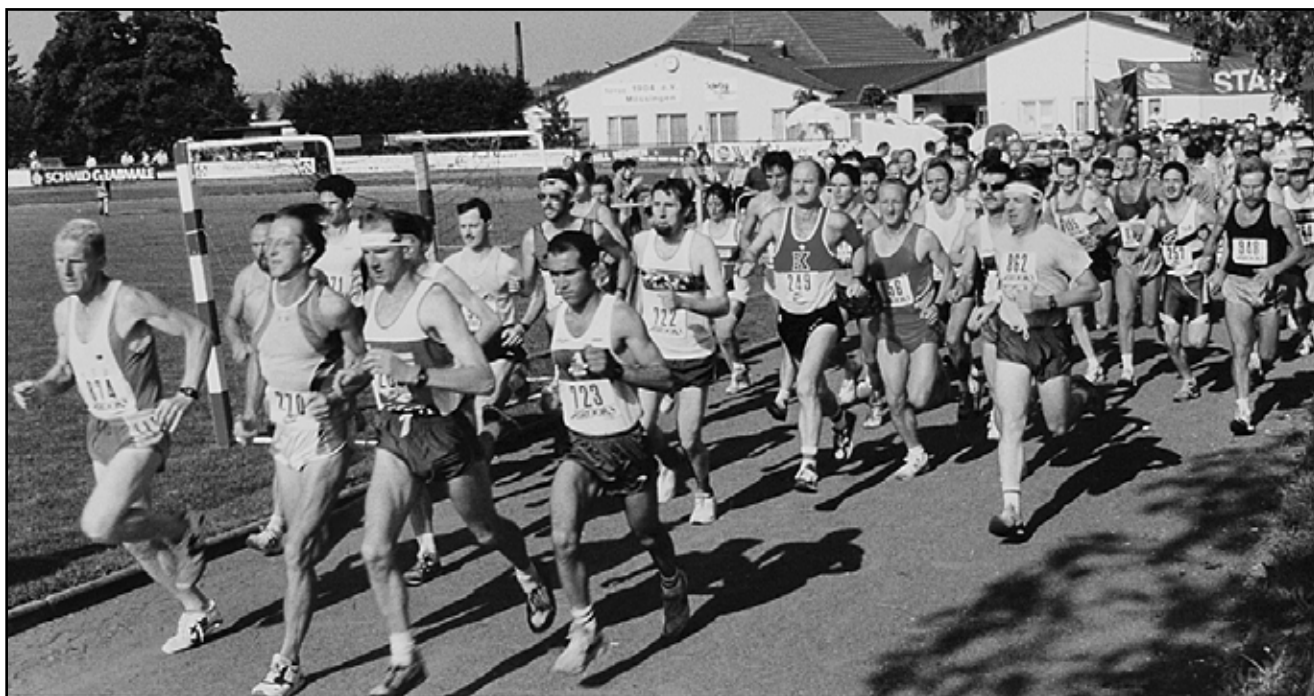
Start zum Volkslauf 1994

Am ersten Volkslauf in Mössingen am 18. Juni 1989 waren 113 Läuferinnen und Läufer am Start. Ab diesem Jahr nahmen die Frauen und Männer an den Württembergischen Volkslauf-Mannschaftsmeister-