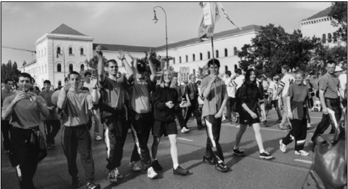
Unten: Die Teilnehmer der Spvgg beim Deutschen Turnfest 1998 in München