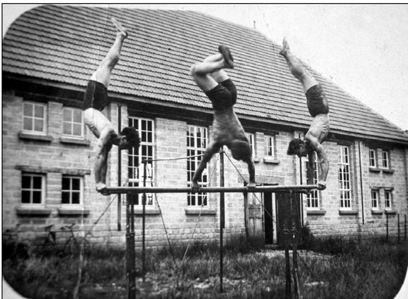
Die Akrobatengruppe des ATSV um 1930

Am 2. Juli 1922 nahm der Verein mit einer