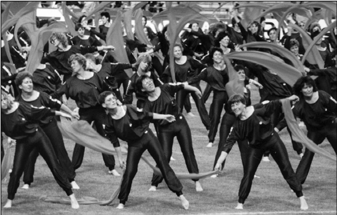
Die Turner bei den Leichtathletik-Weltmeisterschaften 1983 in Stuttgart