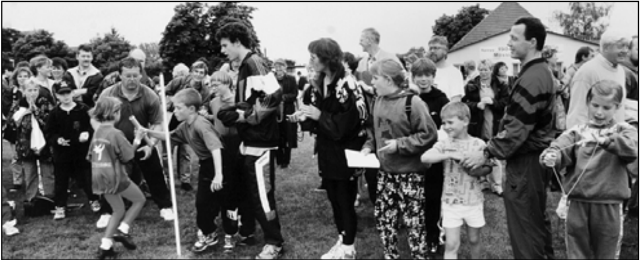
Unten: Gemischte siegreiche Mössinger F-Jugend-Staffel beim Gaukinderturnfest am 6. Juli 1997