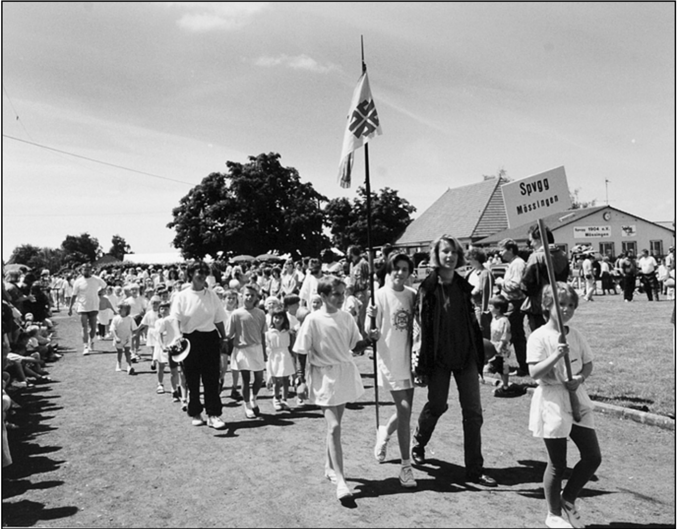
Oben Gaukinderturnfest am 30. Juni 1991. Einzug der Mössinger Kinder